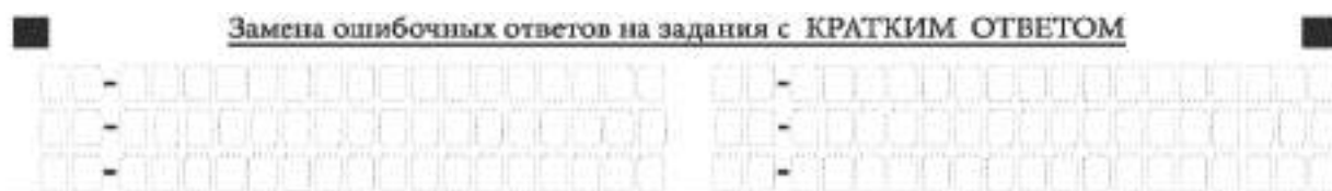
Рис. 10. Нижняя часть бланка ответов № 1 (поле замены ошибочных ответов на задания с кратким ответом)

В нижней части бланка ответов № 1 предусмотрены поля для записи исправленных ответов на задания с кратким ответом взамен ошибочно записанных (рис. 10).